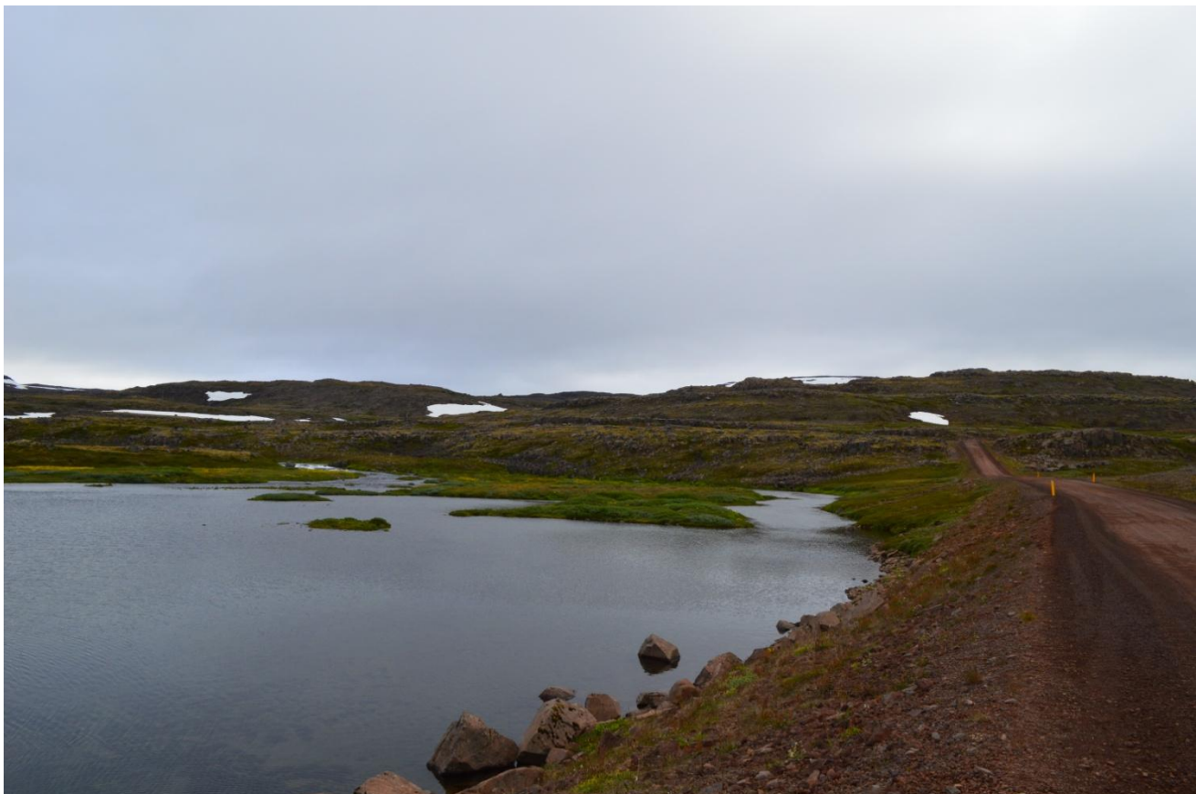
Mynd 6. Dynjandistjörn.