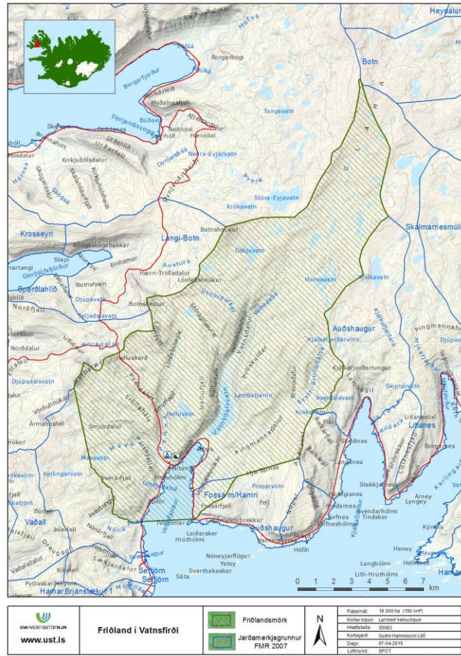
Mynd 2. Friðland í Vatnsfirði. Kort: LMI @ Guðni Hannesson (Umhverfisstofnun).

Náttúrulegur reyniviður og birkiskógur sem breiða úr sér frá flæðarmáli og langt upp á heiðar er einkenni Vatnsfjarðar. Skógurinn ásamt víðáttumiklum leirum eru búsvæði fjölskrúðugs lífríkis. Svæðið er vinsælt til útivistar. Friðlandið er í landi höfuðbólsins Brjánslækjar og eyðjarða sem liggja undir því. Friðlandið er um 20.000 ha og um fjórir fimmtu hlutar þess er grýtt og gróðurlítið hálendi en láglendið er að mestu vaxið kjarri en fyrirhugað framkvæmdarsvæði er að mestu innan þessa gróðurlitla og grýtta hálendis.