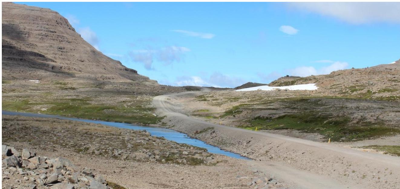
Mynd 3. Sést í Þverdalsvatnið og skaflar enn í ágúst.

misfórst. Sendlingur sást við vatnið 2015 með tvo nýklakta unga. Aðrir fuglar sem hafa sést við vatnið og eru líklega varpfuglar í grennd við það eru heiðlóa, þúfutittlingur og snjótittlingur.