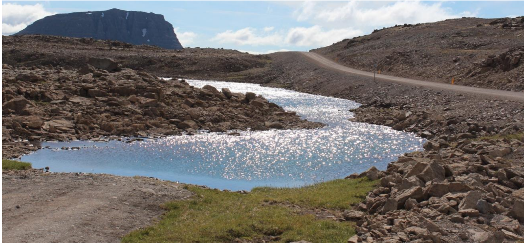
Mynd 4. Djúpavatn, að mestu gróðurlaust við vatnið.

vötnum en skráningum er ábótavant. Það er þó skráð að einn fugl sást á hvoru vatni fyrir sig 3. júlí 2015. Það er hugsanlegt að lómur verpi við annað hvort vatnið (eða til skiptis) stopult en það hefur ekki verið staðfest. Af öðrum tegundum er einungis heiðlóa skráð við Djúpavatn og var það í júlí 2015.