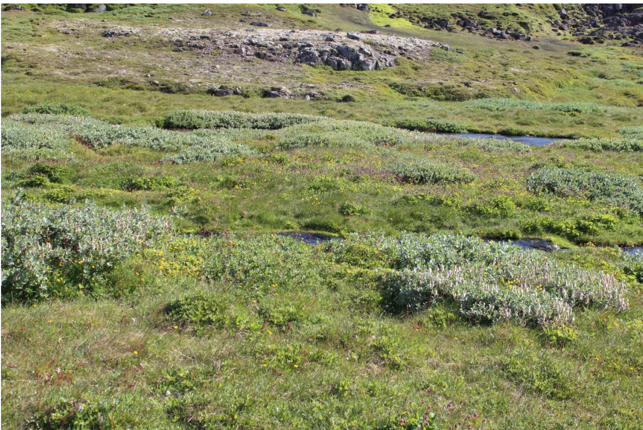
Mynd 5. Trölladalsá og umhverfi hennar.

Trölladalsá liggur meðfram Vestfjarðavegi ofan Geirþjófsfjarðar. Hún sameinast síðan Austurá rétt neðan vegar. Á um hálfu kílómeters kafla meðfram veginum eru árbakkar nokkuð vel grónir (sjá mynd 5) ef miðað er við næsta umhverfi. Á þessum kafla hafa sést straumendur og er ekki ólíklegt að þær verpi meðfram ánni.