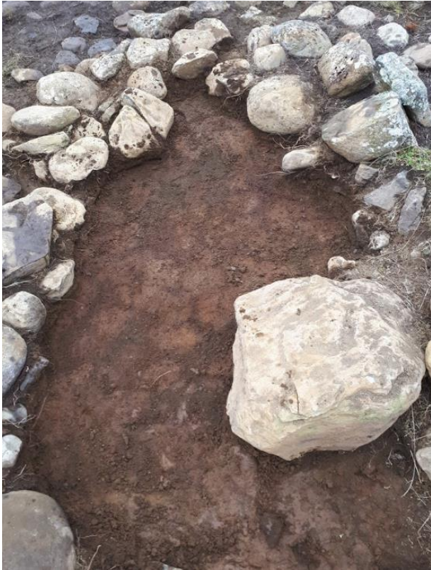
Mynd 4. Torf úr veggjum inn í rústinni.