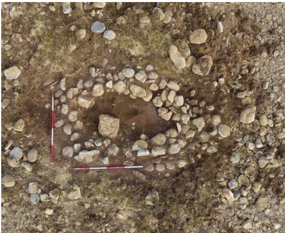
Mynd 3. Rústin sem kom í ljós við rannsókn.

Rannsóknin hófst þann 25.03.2018. Byrjað var á rúst sem staðsett er á Byrgjamel en þar var grjóthrúga og var lyng allt í kring um 2 metra út frá hrúgunni sem var greinilega manngerð þar sem safnað hafði verið saman stærstu steinunum á melnum. Steinahrúgan var teiknuð og ljósmynduð og síðan var hafist handa við að fjarlægja hrúguna. Þá kom í ljós hleðsla sem var ílöng um það bil 2,2 m á lengd og um 1,5 m á breidd og virtist vera dropalaga með engan sýnilegan inngang. Þegar þarna var komið við sögu var ekki hægt að grafa meira því jarðvegur var frosinn og var því rannsókn frestað þar til frost væri farið úr jörðu. Var búið vel um rústina með jarðvegsdúk, plasti og vörubrettum vegna þess að þessi steinsetning minnti óneitanlega á kuml úr heiðnum sið. Ákveðið var í samráði við minjavörð Norðurlands vestra að fresta frekari rannsóknum fram á vorið. Þann 29.05.2018 var aftur farið á svæðið og með í för var Dr. Guðný Zoëga mannabeinafræðingur frá Byggðasafni Skagfirðinga. Frost var farið úr jörðu og því ekkert því til fyrirstöðu að hefja rannsóknina að nýju. Næsta lag á eftir þeim steinum [101] sem voru ofan á rústinni [102] var torflag [103] sem fyllti rústina að innan. Greinilegt var að rústin hefur verið úr torfi og grjóti sem höfðu fallið inn í rústina. Undir torfinu var náttúrlegt sandlag [104] sem var alveg óhreif. Grafið var dýpra með skóflu til að ná fram fullvissu að ekki væri um að ræða kuml. Reyndist um að vera lítið hús eða byrgi. Mögulega var um að ræða smalaskýli.