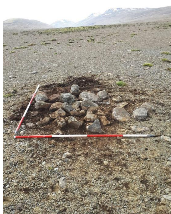
Mynd 7: Varðan við rannsókn.