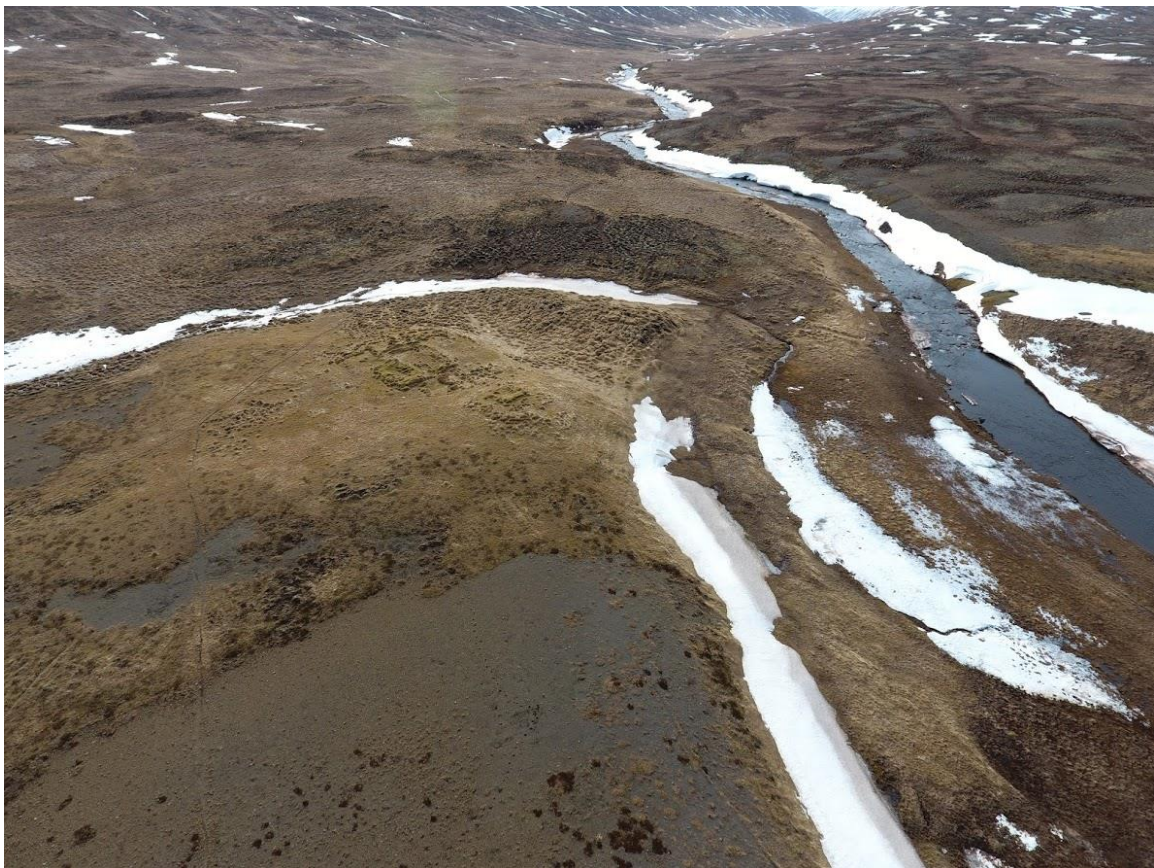
Mynd 2. Rústir nærri rannsóknarsvæði kallast Byrgi og voru fjárhús frá Tjörn og þar var einnig búseta um tíma.

Melurinn er að mestu ógróinn nema þar sem rústin sem grafið var í var. Í kring um rústina var lynggróður sem náði í hring u.þ.b. 2 metra út frá rústinni. Á Herforingjaráðskortum er Byrgi merkt sem eyðibýli og í jarðabók Árna Magnússonar og Páls Vídalín segir svo „Byrgistopter hefur aldrei býli verið, en þó eins manns húsmenska um eitt ár alleina í fjárhússtæði staðarhaldarans, og fylgdi því engin grasnyt, nema sú ein, er staðarhaldarinn af sinni venjulegu heimagrasnautn, slægjum og töðum, lagði hjer til; mætti hjer að vísu byggð gjöra en þó ekki nema til meins og skaða heimastaðnum. — Hvað húsaleiga var er óvíst. — Alt það er fóðrast kunni, er áður talið með heimastaðarins fóðrapeníngi. 1 “ Ljóst er að þessaro frásögn að einhver hafðist við í fjárhúsum staðarhaldarans á Tjörn í byrjun 18. aldar. Mögulega er um gamalt býli að ræða.