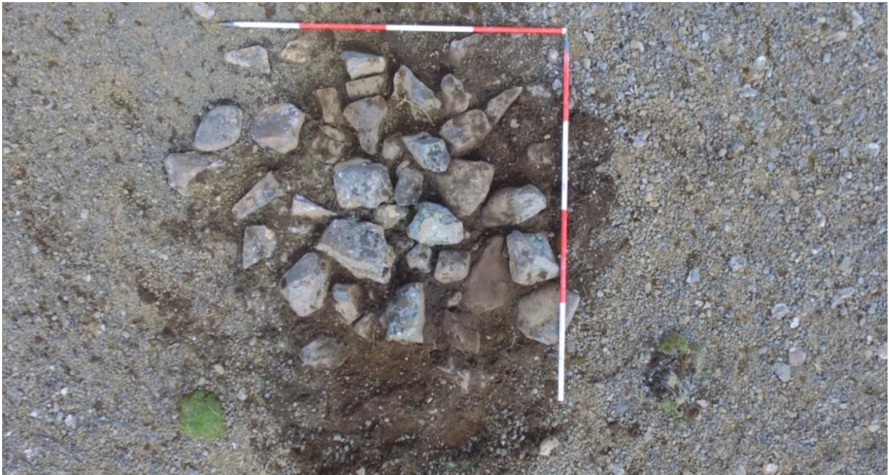
Mynd 8: Varðan við rannsókn.