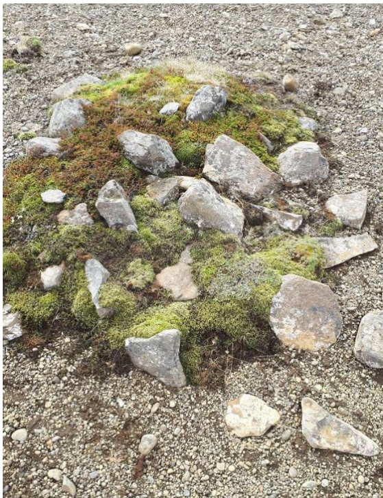
Mynd 6: Varðan fyrir rannsókn.

Síðar var farið að minni steinahrúgu sem var staðsett nokkuð frá á syðri bakka Katadalsár þar sem heitir Syðri Tjarnarmelur. Eftir að steinar höfðu verið teiknaðir og ljósmyndaðir voru þeir fjarlægðir og kom í ljós að um var að ræða vörðu.