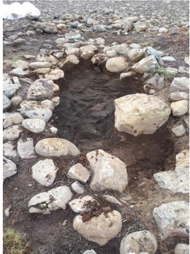
Mynd 5. Sandlag sem var undir torflagi.