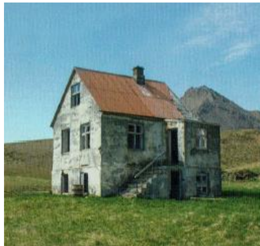
Mynd 2. Mynd af íbúðarhúsinu á Tjaldanesi (tekin úr bókinni „Eyðibýli á Íslandi“)

Ræktunarmöguleikar í nágrenni bæjarins eru ekki miklir. Heimatún bæjarins gæti verið um 10 ha neðan núverandi túngarðs. Nokkur halli er á túninu í átt að sjó svo það liggur vel við sól um hádaginn. Það væri mögulegt að vera þarna með sauðfjárbú en ekki stórt, nema að vera með tún á öðrum bæjum samhliða búskap á Tjaldanesi. Jörðin hentar alls ekki til nautgriparræktunar þar sem hún er ekki í vegasambandi allt árið. Hugsanlegt er að vera með skógrækt á þessu svæði þar sem jörðin liggur vel