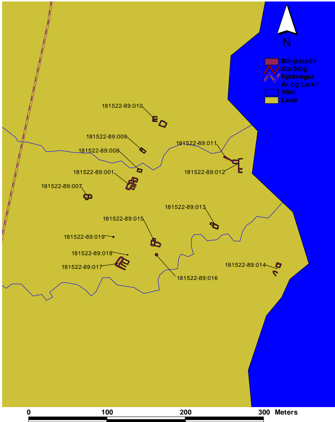
Kort 6. Minjastaðir í landi Auðna.