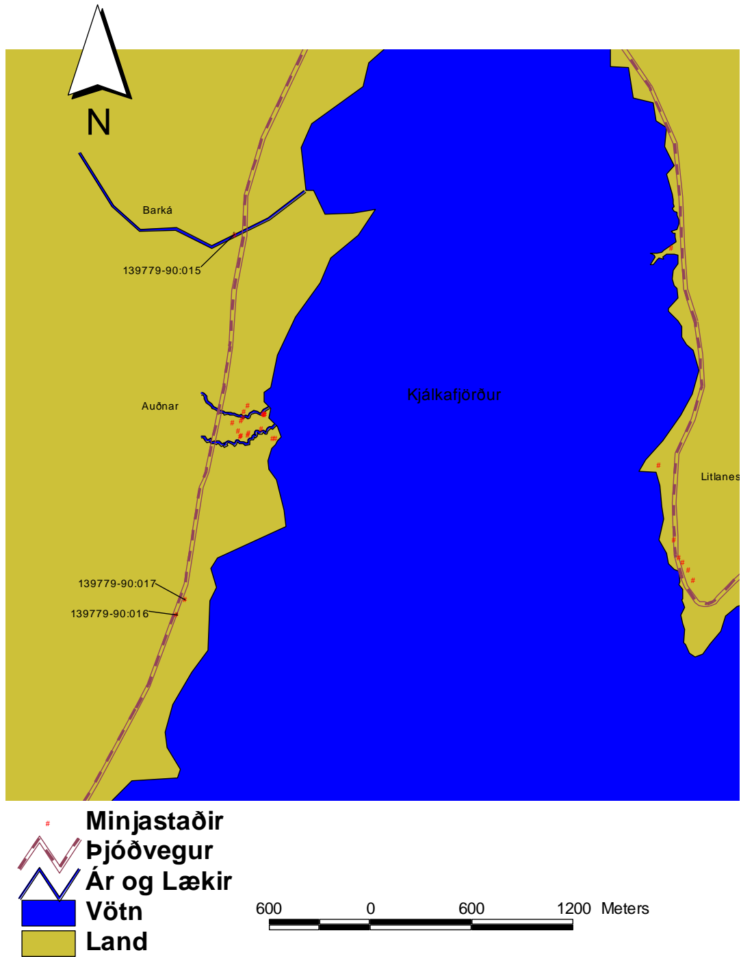
Kort 5. Minjastaðir norðan Auðshaugs.