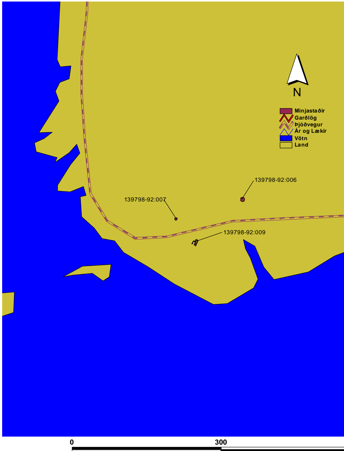
Kort 3. Minjastaðir á Hjarðanesi í landi Fossár.