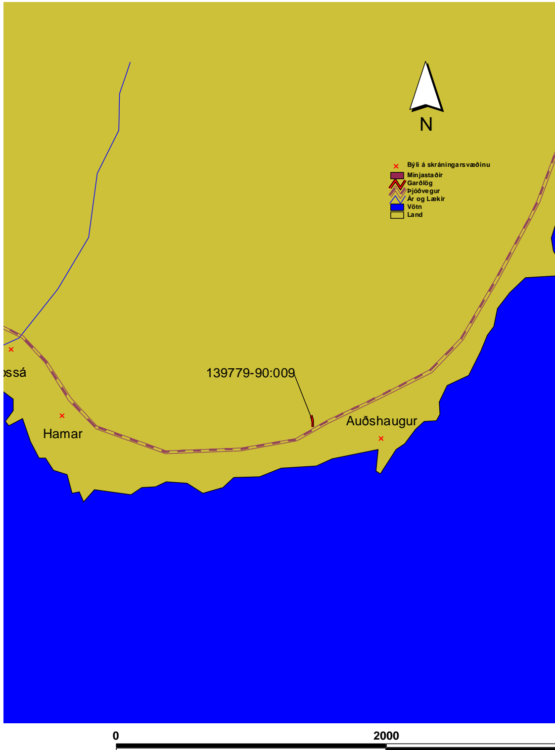
Kort 4. Minjastaðir í landi Auðshaugs.