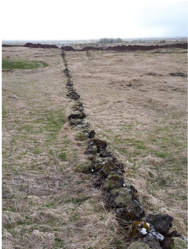
Mynd 2. Yngri túngarðurinn í Vorsabæ.

Minjalýsing: Yngri túngarðurinn liggur að mestu við hliðina á þeim eldri en þó skilur hann sig frá honum á nokkrum stöðum þar sem túnið virðist hafa verið stækkað aðeins. Þessi garður er greinilega mun yngri. Það sést á beinum línunum hans og að hann er ekki gróinn eins og sá gamli. Yngri garðurinn er mun efnisminni og hefur verið mun mjórri, oft ekki nema tvær raðir af steinum. Líklegt er að girðing hafi verið ofan á yngri garðinum meðan hinn hefur verið í fullri hæð. Líklegt er að Yngri garðurinn er 940 m á lengd.