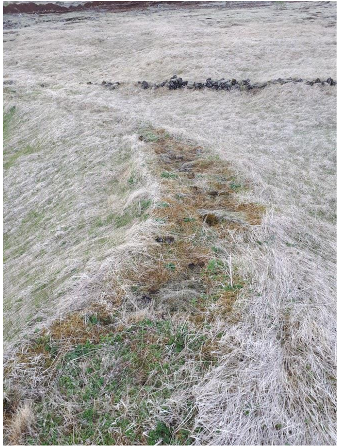
Mynd 1. Gamli túngarðurinn þar sem hann er greinilegastur, sá yngri sést aftar.

Minjalýsing: Gamli túngarðurinn er mjög sokkinn og útflattur og er nær alveg mosavaxinn hann fylgir náttúrlegum línunum túnsins sem eru mótaðar af þeim hraunklöppum sem eru í túninu. Garðurinn er um 2-3 m á breidd og hæstur um 20 cm. Gamli garðurinn er um 570 m á lengd. Norðarlega í túninu má greina smá rétt sem byggð hefur verið við túngarðinn. Gjóskurannsókn sem fór fram sumarið 2018 og gerð var af Magnúsi Sigurgeirssyni jarðfræðing sýndi að eldri túngarðurinn er byggður eftir 1226 en ekki mikið eftir það. Garðurinn er því nokkuð forn.