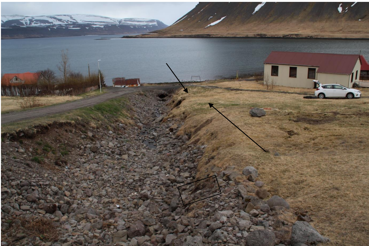
Mynd 7. Stekkjargil og húsið Gilbakki. Örvar benda á hvar minjar eru í bakkanum.