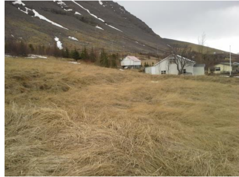
Mynd 11. Svæði þar sem matjurtargarðarnir eru.

Gerðar voru litlar prufuholur. Í ljós kom að ekki eru hleðslur við matjurtargarðinn heldur er hann bara niðurgráfin. Ekkert eldra er undir garðinum. Samkvæmt heimildarmönnum er ekki um fornleif að ræða og var garðurinn síðast notaður fyrir 10 árum.