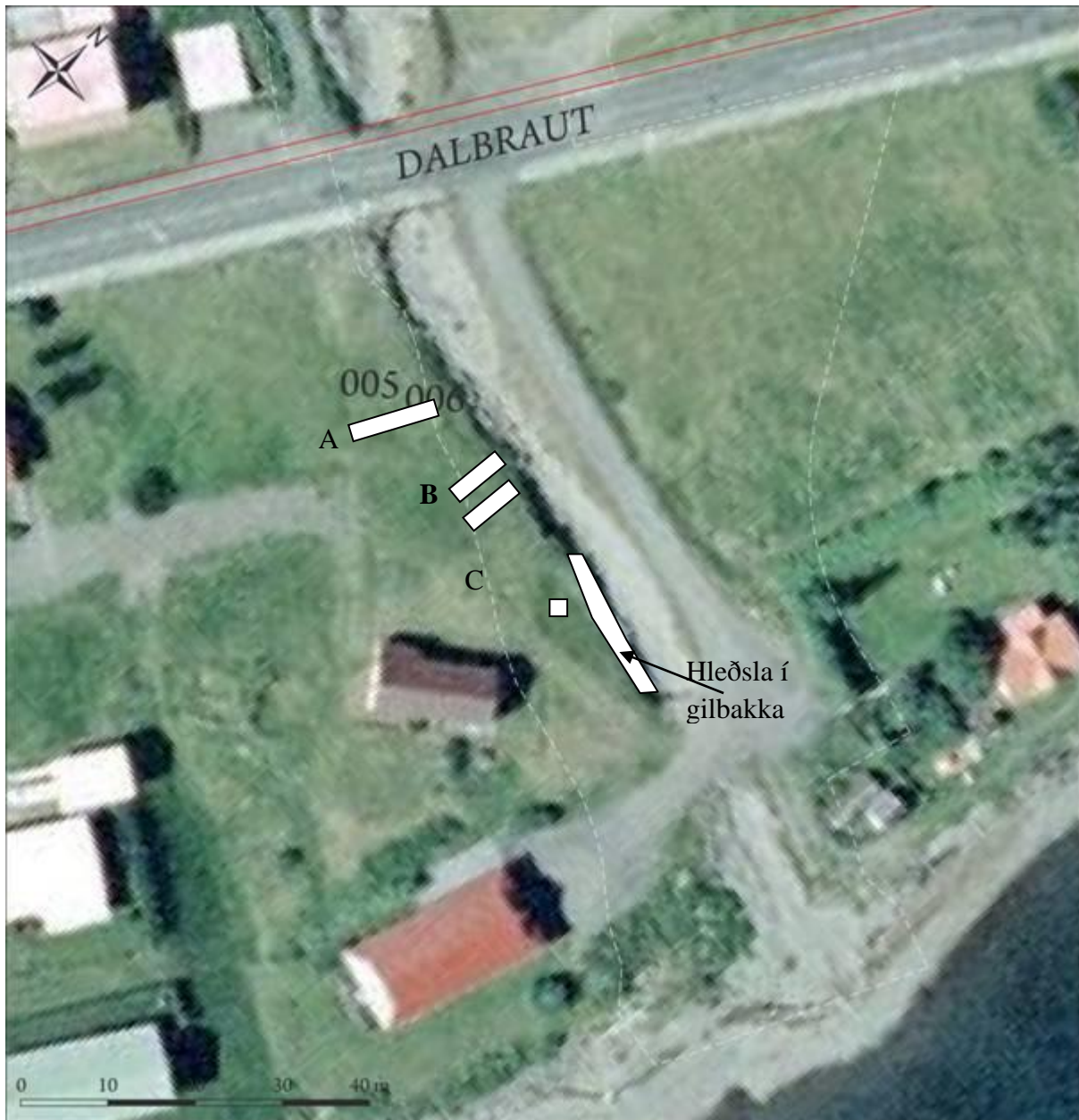
Mynd 8. Mynd sem sýnir áhrifasvæði framkvæmda og staðsetningu skurða við rannsóknina.