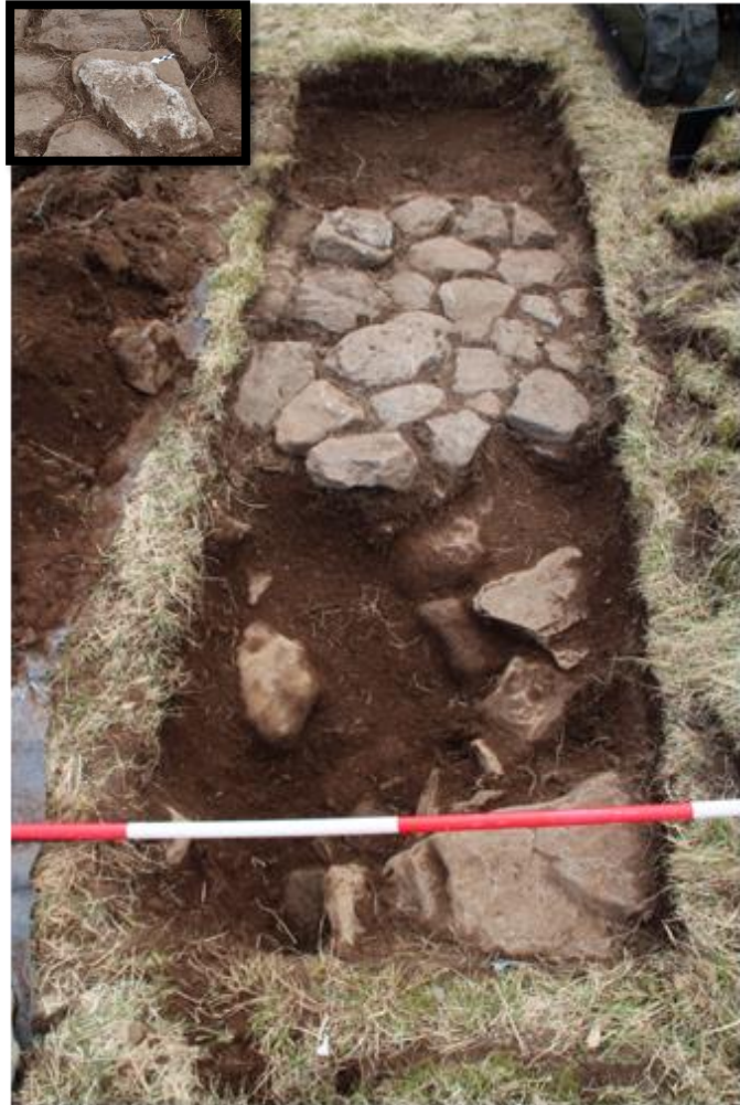
Mynd 3. Skurður B. Hleðslur sjást fyrir miðjum skurði. Á innfeldu myndinni sést steypa á einum steinana.

Skurðurinn fékk bókstafinn (B) og var 1x3 metrar að lengd. Torf var skafið af með lítilli gröfu. Efst var raskað lag#[201] og rétt undir því í miðjum skurði kom í ljós hleðsla #[202]. Í yfirborðslagi og allt í kring um hleðsluna var rusl aðallega járn og töluvert að böndum úr plastefnum. Mikið var að nöglum í laginu og einn 25 aura peningur með ártalinu 1960. Í hleðslunni sem stóð úr bakkanum var steypur veggur.