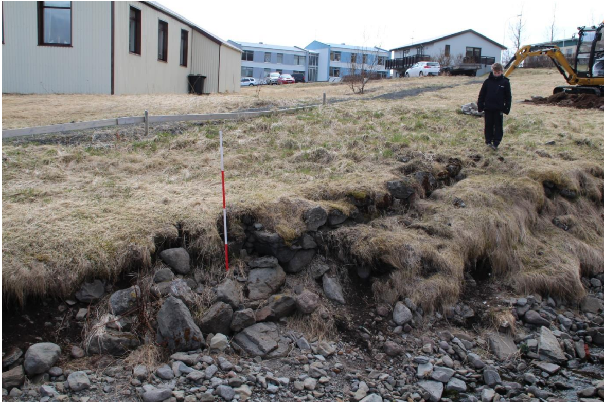
Mynd 6. Hleðslan í bakkanum. Tekinn var skurður til að athuga hvort um væri að ræða byggingu en ekkert kom fram sem benti til þess.