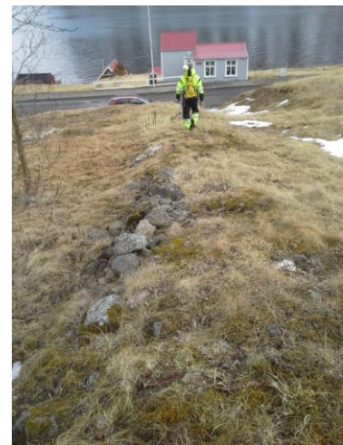
Mynd 14. Garður ofan við Gilhaga.

Við rannsókn á garðinum kom í ljós að hann er ekki hlaðinn, heldur er um að ræða að skriðan hefur verið hreinsuð til að slétta við fyrir byggingu á íbúðarhúsi númer 34 við Dalbraut. Efninu hefur verið rutt til hliðar og myndað garð, sem hefur myndað vörn fyrir