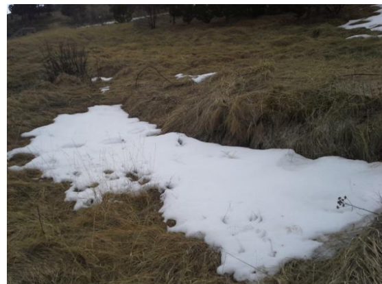
Mynd 12. Niðurgröftur sem hefur hugsanlega verið grunnur af litlu húsi.

Við rannsókn kom í ljós að um er að ræða undirstöður lítils hús sem hefur verið með steypu gólfi. Ekkert eldra er undir húsinu, aðeins óhreyfð skriða sem húsið stendur á.