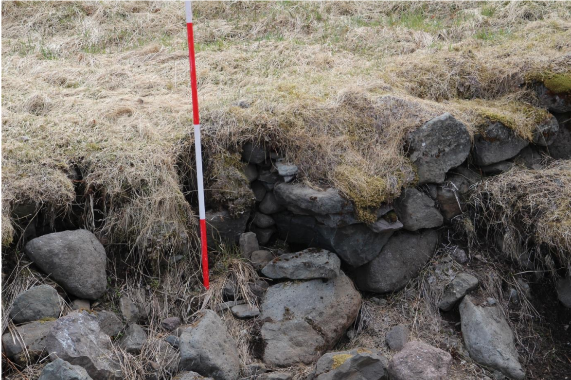
Mynd 9. Hleðsla í gilbakkanum.