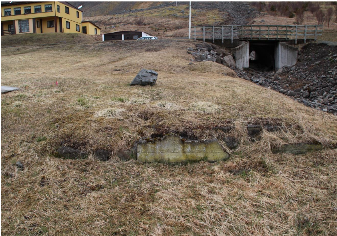
Mynd 2. Steyptur veggur frá útihúsunum, þar sem skurður A var tekinn.

mannvistarlag í miðjum skurðinum #[001], sem hafa verið á yfirborði við hlið rústarinnar. Í laginu var nokkuð af járngripum, nöglum og þvílíku. Lagið var þétt og traðkað ljósbrúnt með ljósum skellum. Við hlið þess var svipað lag #[002] en það lag var í vesturenda skurðarins. Þar var hrunið þak úr bárujárni sem hefur verið á húsinu. Í austurenda skuðarins var óhreyft lag út skriðunni sem húsið er byggt í. Undir lögum [001 og 002] var óhreyft lag [004] sama og [003]. Enginn merki fundust um að eldri bygging hafi staðið þarna. Heimildarmenn muna eftir útihúsunum sem stóðu vel fram yfir miðja síðustu öld svo líklegt er að þau hafi verið notuð frá um 1900-1970.