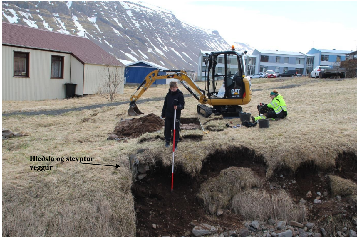
Mynd 4. Hleðslur sem tilheyra bygginguni sem kom fram í skurði B þar sem þær eru að falla í gilið.