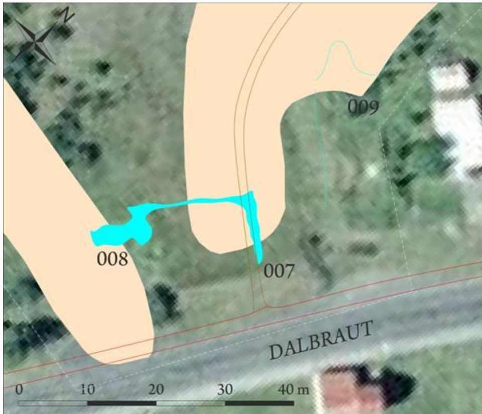
Mynd 13. Minjar [007] og [008] (Margrét H. Hallmundsdóttir 2014).