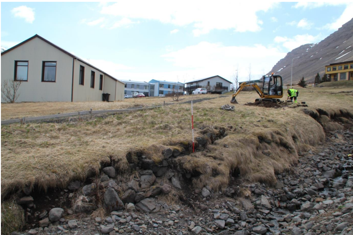
Mynd 10. Hleðslur í gilbakkanum .