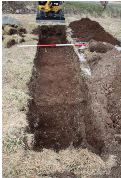
Mynd 1. Skurður A. Þar fannst járn úr þaki útihúsa en engin merki um eldri byggingu.

Gerður var könnunarskurður rétt ofan við rústina þar sem hæð rústabungunnar er hæst. Yngsta byggingin er greinanleg á yfirborði og sér í steinsteypta vegg og steyp gólf sem er gróið. Skurðurinn var gerður ofan við vegginn til að kanna hvort eldri rúst væri undir eða við hlið yngstu rústarinnar. Skurðurinn var nefndur skurður (A). Skurðurinn var 1x5 metrar á lengd og var tekið ofan af með lítilli gröfu. Strax og torf hafði verið tekið ofan af, komu í ljós hreyft