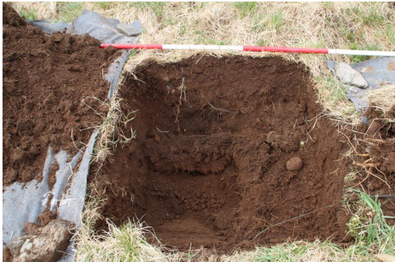
Mynd 5. Skurður D.

Aðeins neðar en könnunarskurðirnir voru gerðir á mótis við húsið Gilsbakka, sem byggt var árið 1890, er hlaðinn veggur. Veggurinn er hugsanlega til að varna því að ekki étist út gilinu við flóð og grafi undan húsinu. Hleðslan er á mótis