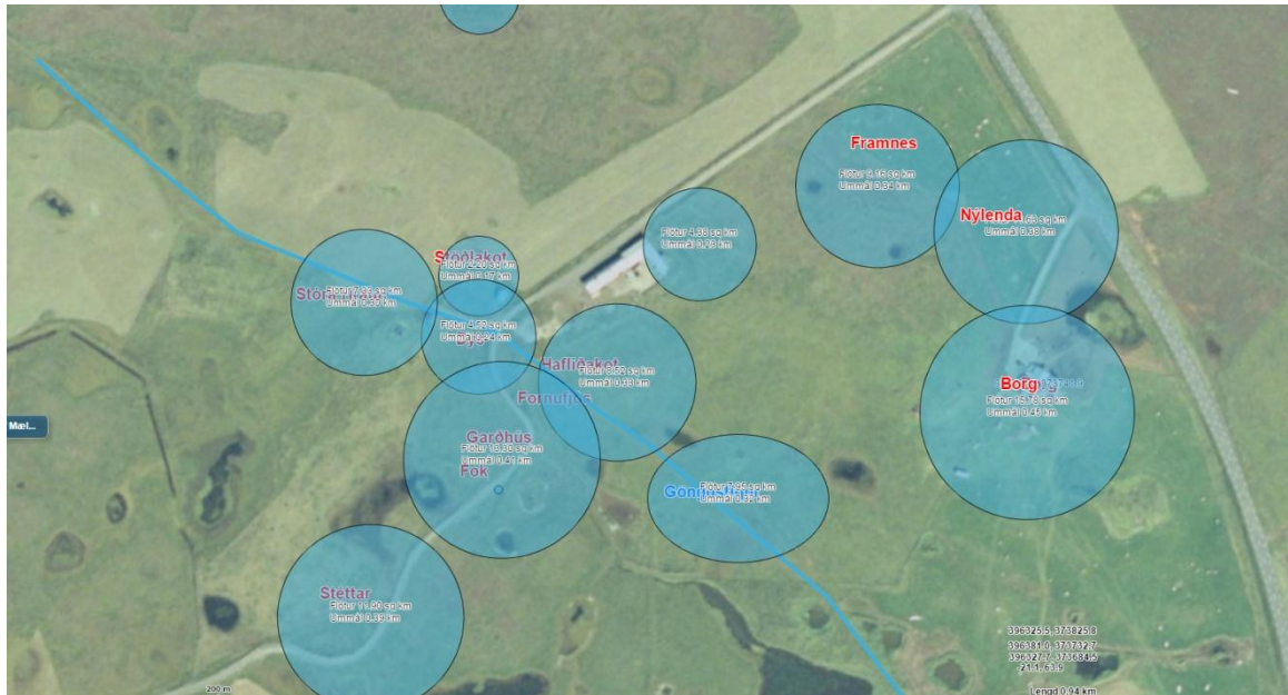
Mynd 1. Skjámynd af vefsíju Landmælinga sem sýnir áhrifa svæði hvers býlis og fyrirhugaðan göngustíg.