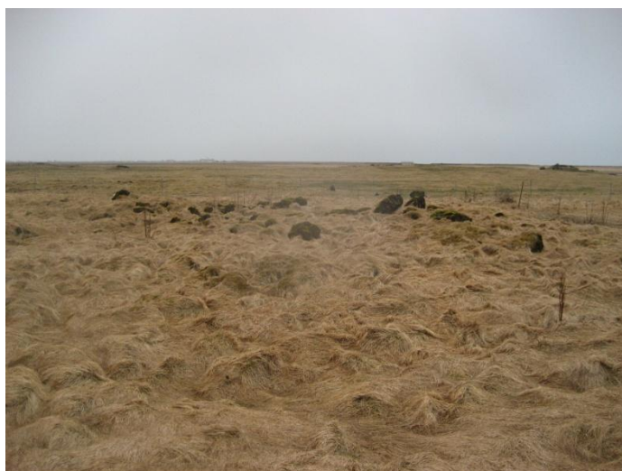
Hluti að rústasvæðinu. Tekið í suður.

Lýsing: Mikið er um þústir á svæðinu og nokkuð háar allt að 2 m. Mikið hraun stendur upp úr jarðvegi og myndar á mörgum stöðum beinar línur sem oft bendir til mannvistaleifa. Eining er mikið um dældir á svæðinu. Þegar þetta er allt skoðað saman eru nokkrar líkur að þessar þústir séu merki um að þarna hafi staðið mannvirki. Svæðið var allt skráð saman á eitt númer.