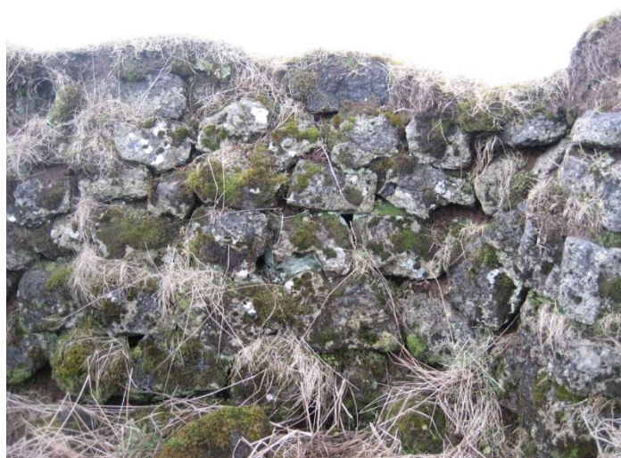
Hleðslur í suðurvegg útihús