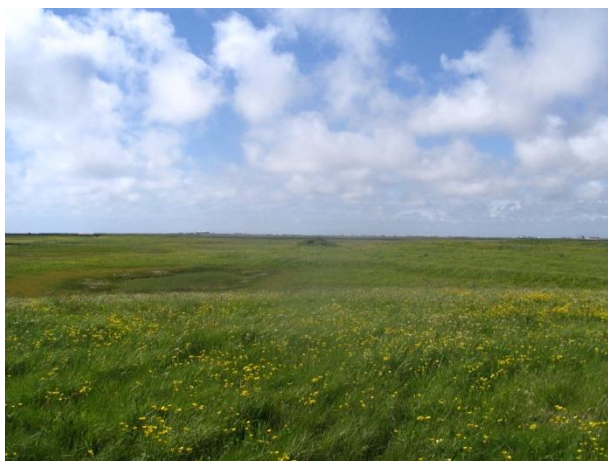
Bæjarhóll Hafliðakots. Tekið í suður.

Lýsing: Í Jarðabók Árna Magnússonar og Páls Vídalín er Elliðakot talin upp sem fyrsta hjáleiga Hrauns. (Árni Magnússon og Páll Vídalín. 1921:70) Á túnakorti er bær Hafliðakots