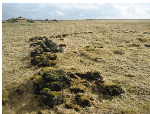
Garðlag, líklega rétt af einhverju tagi, útihús í fjarska.