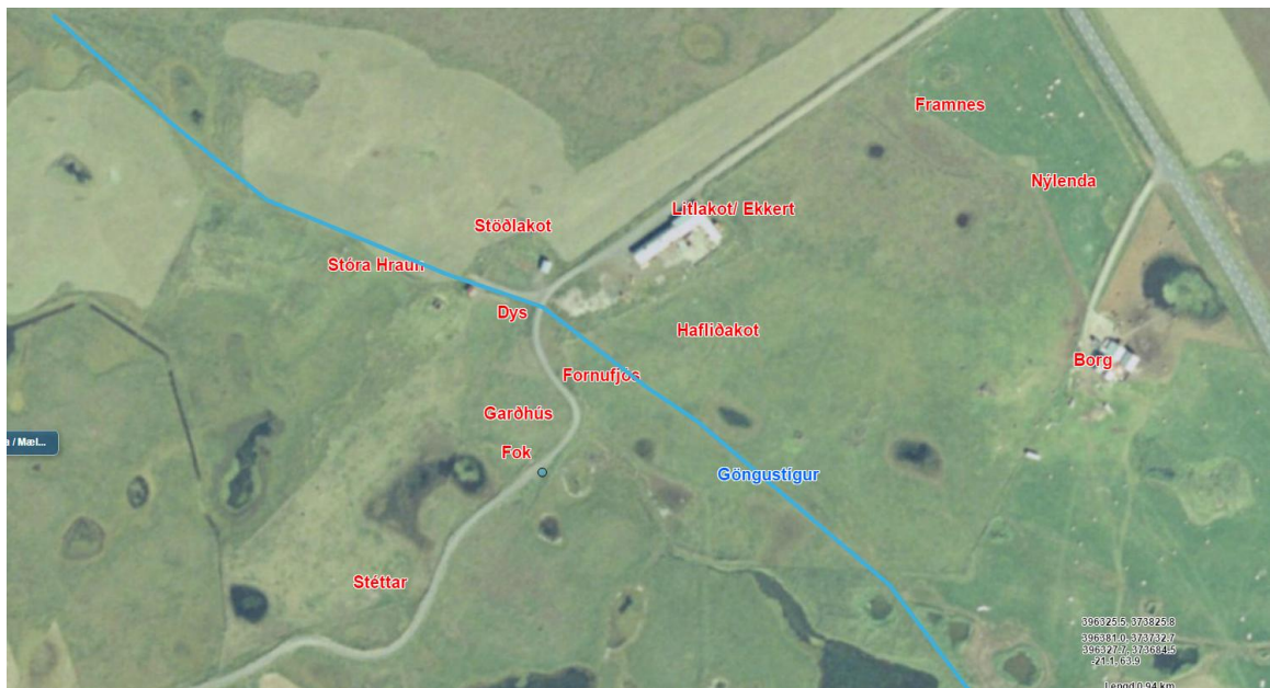
Mynd 2. Skjámynd af vefsíju Landmælinga sem sýnir hvar býlin stóðu og afstöðu við göngustíg.