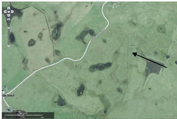
Mynd 1. Skjáskot af kortasjá Minjastofnunar. Örin bendir á veginn eða „brúnna..“

Íslenzkir sagnaþættir og þjóðsögur. 1940. Skrásett af Guðna Jónssyni. 1 bindi. Ísafoldarprentsmiðja, Reykjavík.