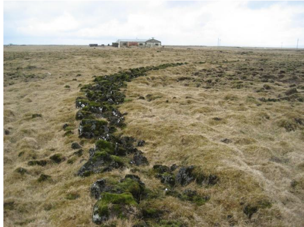
Garðlag innan deiliskipulagsreits.

Lýsing: Garður þessi er hlaðinn úr hrauni og er mikið sokkinn, hugsanlega hefur grjót verið tekið úr honum. Garðurinn lítur út fyrir að vera nokkuð gamall. Garðurinn hefur verið rofinn af