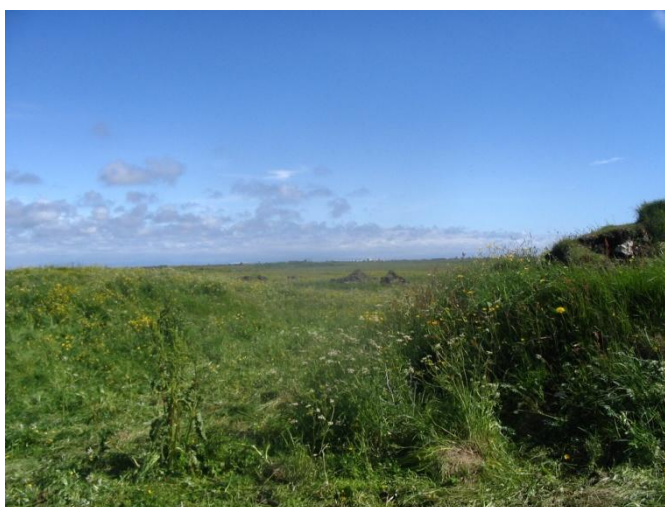
Þúst við hlið útihúss í vinstra horni myndar. Tekið í norður.

Túnakort [1920]. Hafliðakot. Eyrarbyggð, Árnessýsla. Þjóðskjalasafn Íslands.