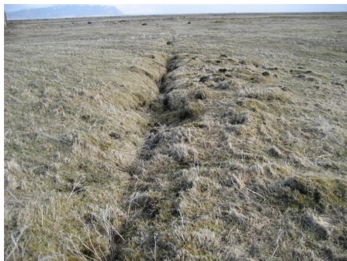
Troðningur við bæjarhól Hafliðakots. Tekið í norður.

Lýsing: Troðningurinn er um 30 cm djúpur og liggur meðfram bæjarhól og í norðurátt í átt að Beinaverksmiðju. Ekki er víst hversu gömul leiðin er