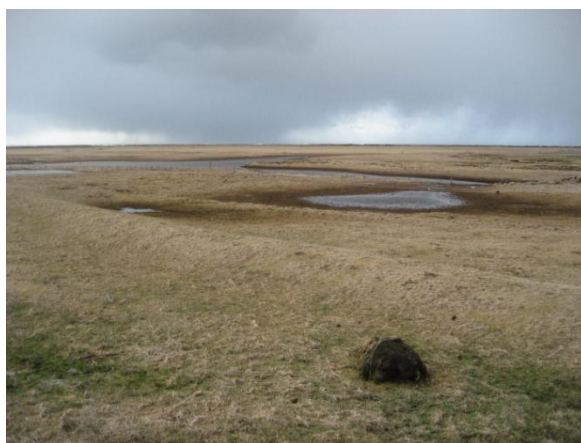
Vegur í átt að bæjarhól. Tekið í suður.

Staðhættir: Á túnakorti sem líklegast var teiknað um 1920, er skráð leið. (Túnakort [1920].) Frá bæjarhól Hafliðakots í austur í átt að bænum Borg má sjá upphækkun í landinu. Er þetta að öllum líkindum vegur, ólíklegur er að um sokkinn túngarð sé að ræða þó það sé